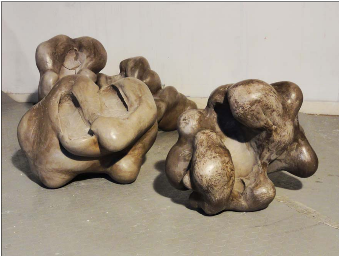
Chemin de mousse , 2010 50 x 55 x 60 cm quatre pièces en céramique