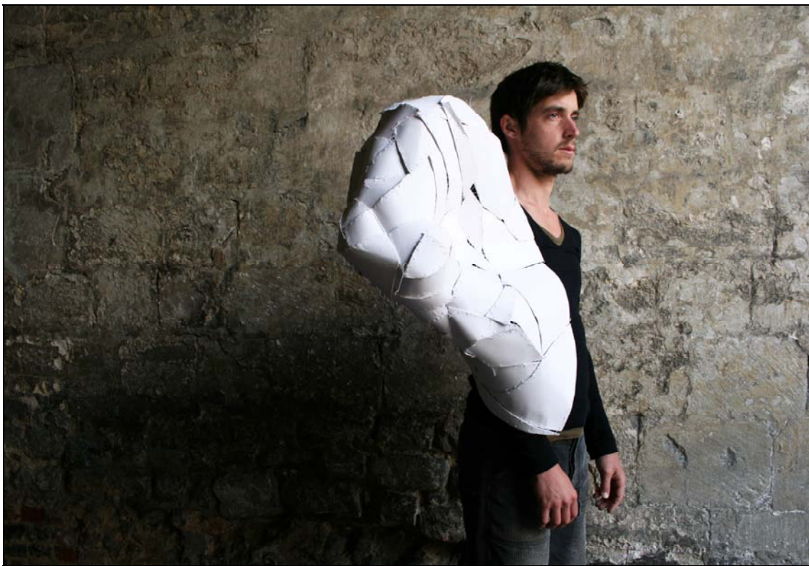
English Cloud , 2010 50 x 60 x 70 cm papier