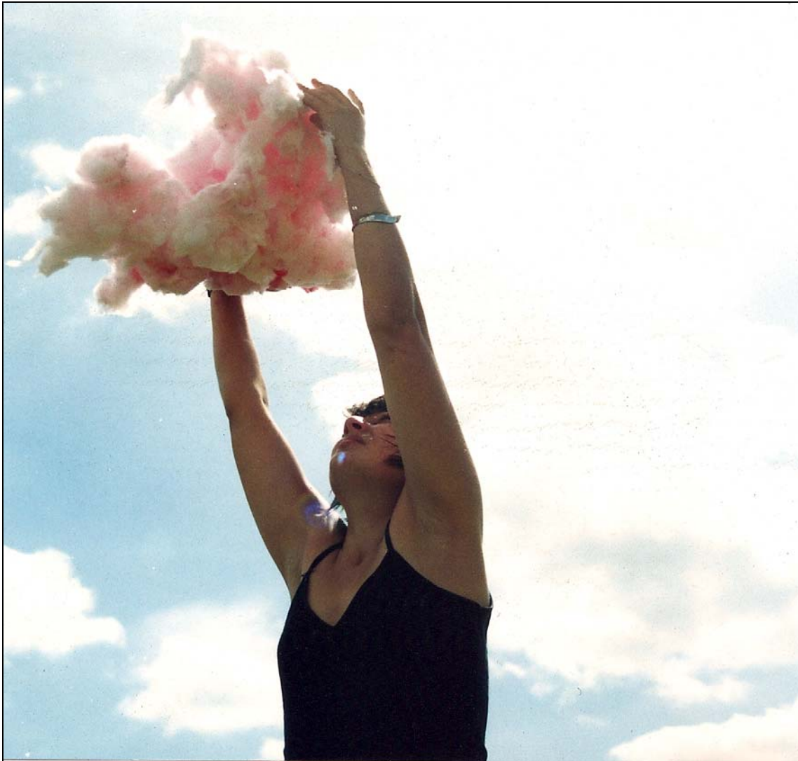
Barbe à Papa , 2008 dimensions variables photographie argentique