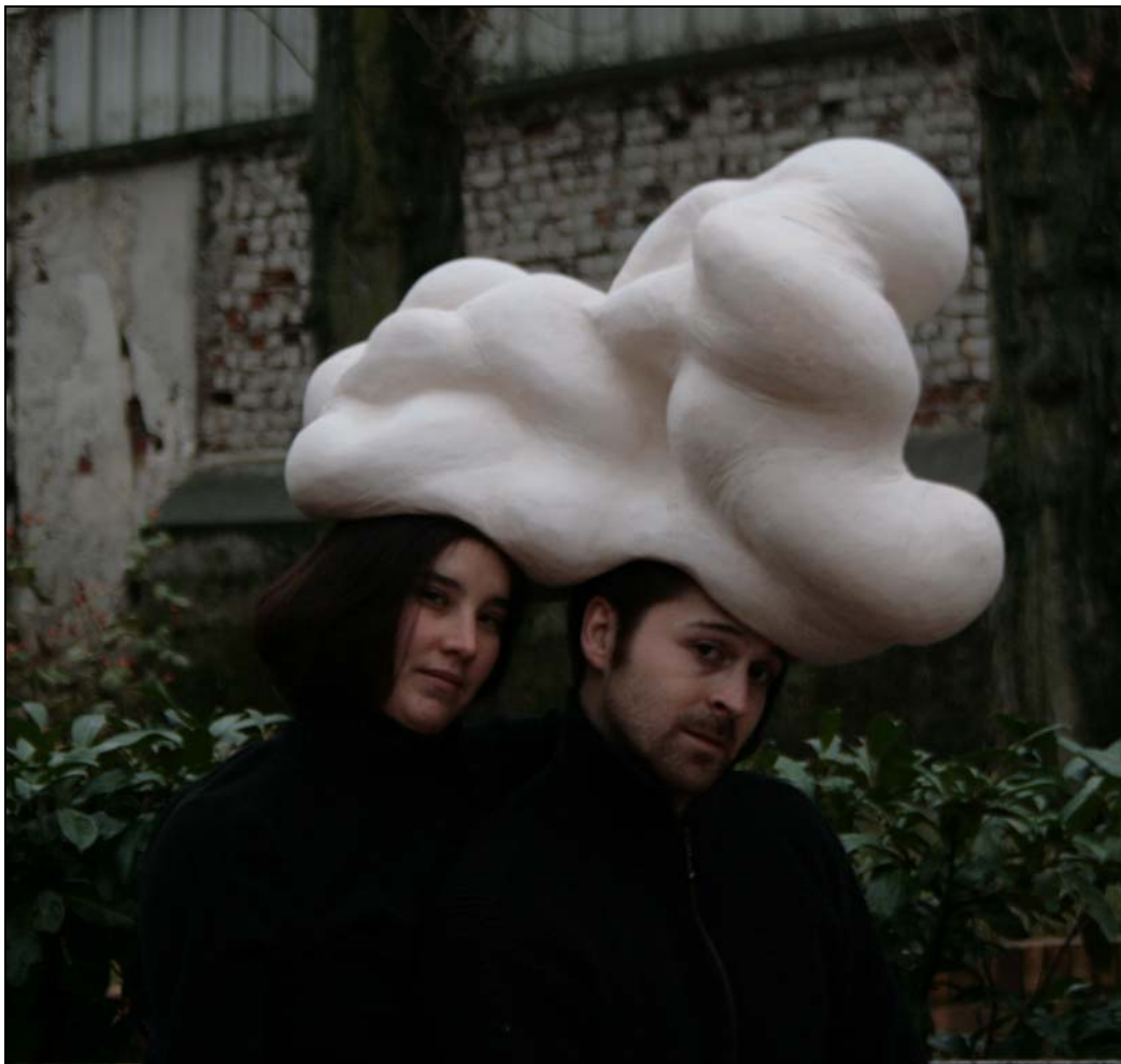
Dessous (Prêt à porter), 2010 70 x 60 x 60 cm céramique