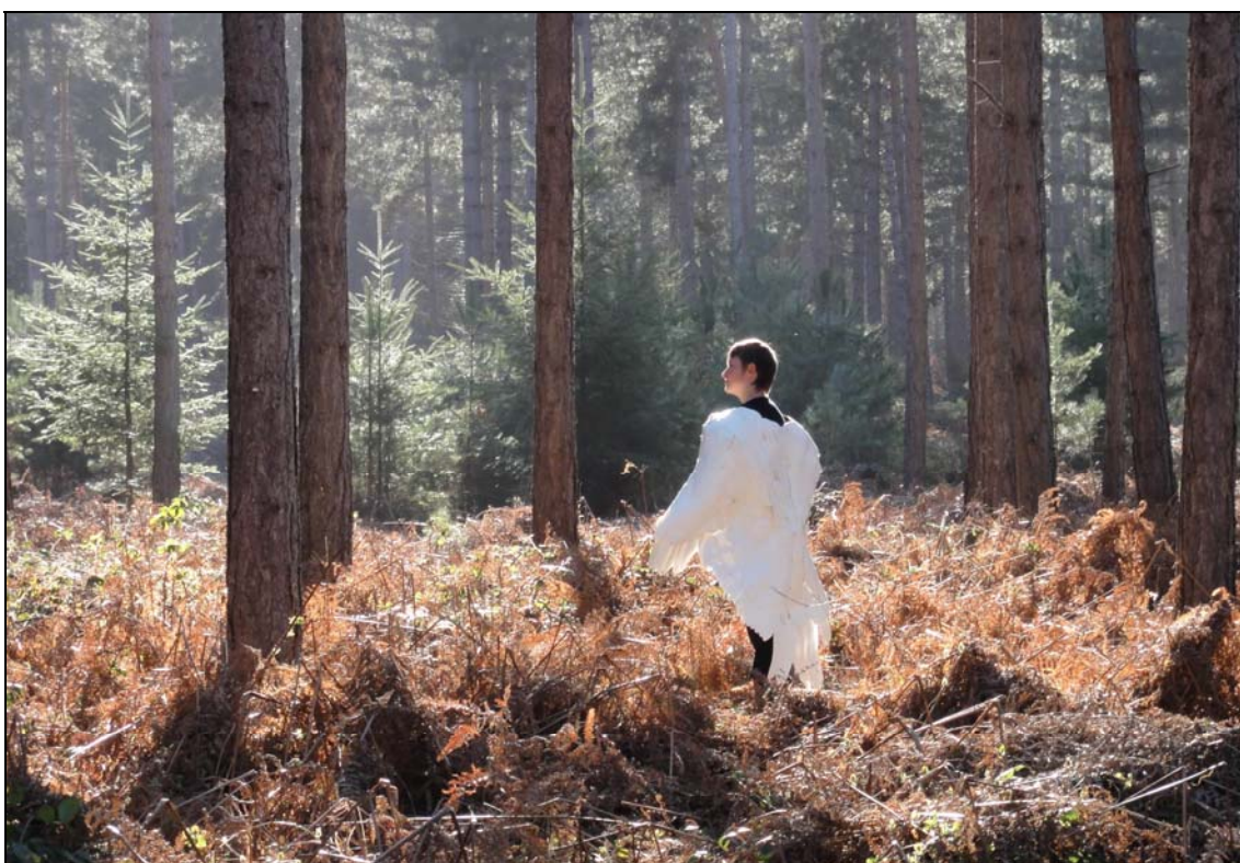
Manteau de papier , 2011 130 x 140 x 50 papier et colle