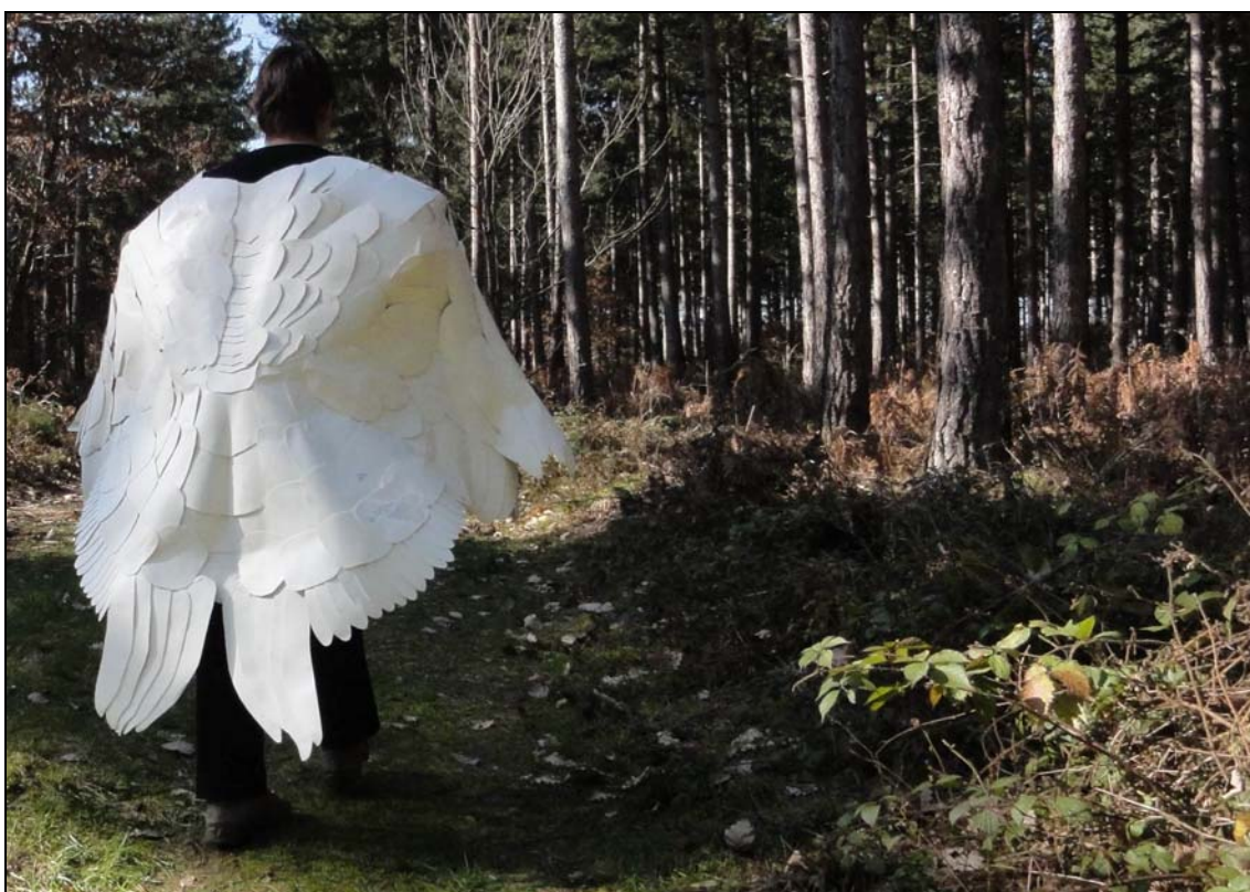
Manteau de papier , 2011 130 x 140 x 50 papier et colle