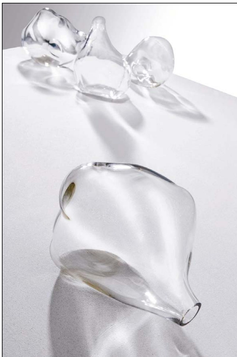
Nubes Expirum , 2008 30 x 20 x 20 cm verre soufflé