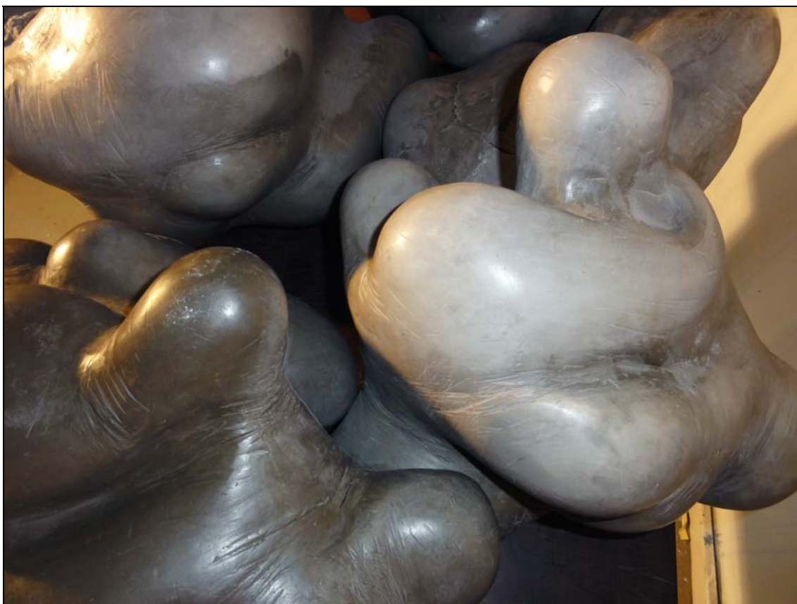
Chemin de mousse (détail) , 2010 50 x 55 x 60 cm quatre pièces en céramique