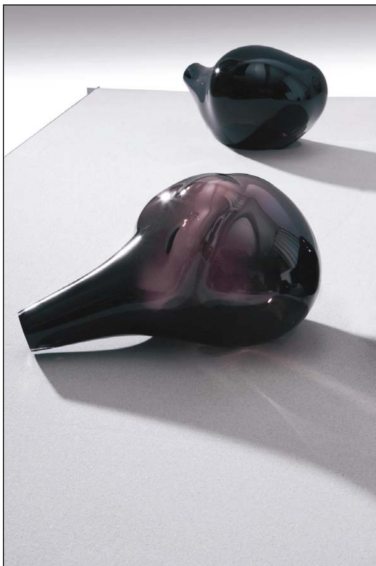
Nubes Expirum , 2008 30 x 20 x 20 cm verre soufflé