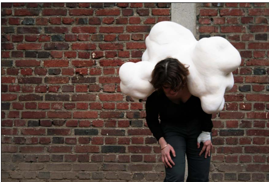
Lourd (Prêt à porter), 2010 80 x 70 x 60 cm céramique