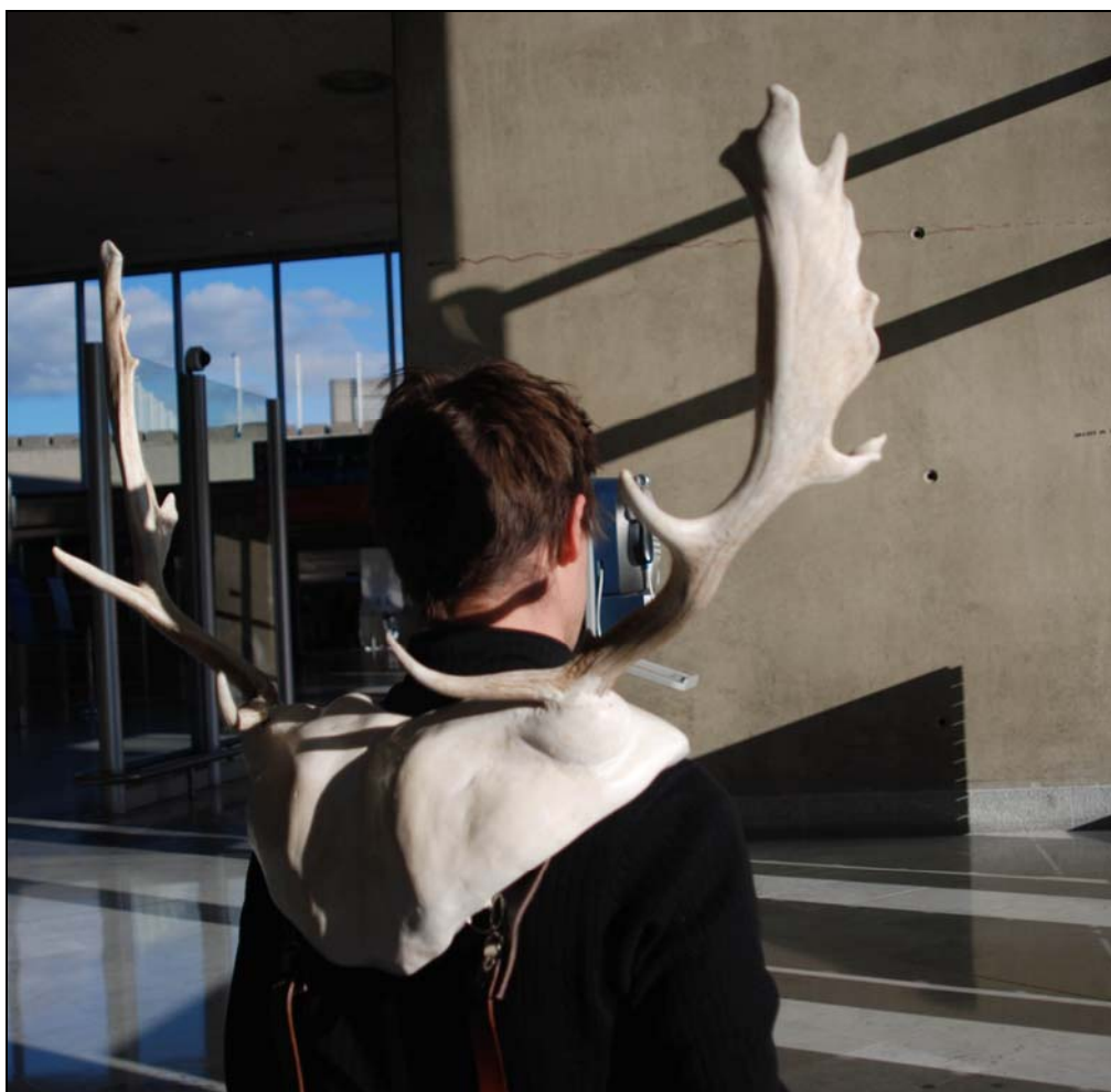
The Messenger , 2010 70 x 70 x 40 cm Résine, cuir, bois de cerf