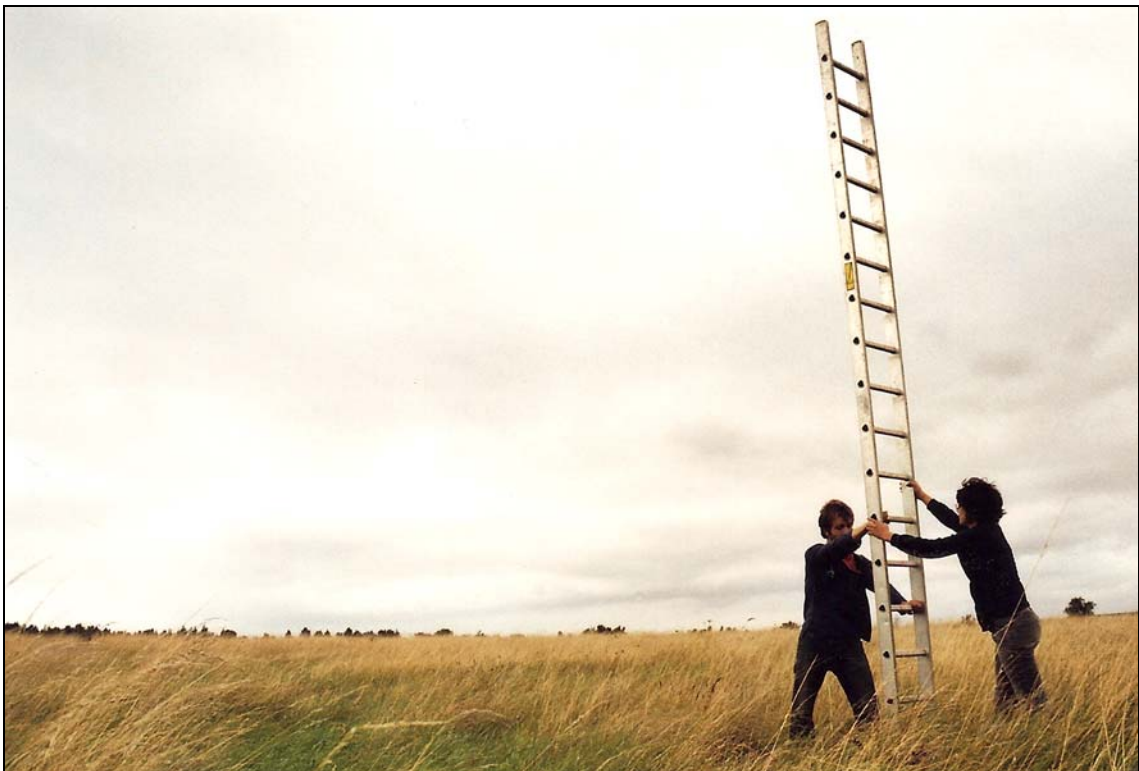
J'arrive pas à dormir , 2008 dimensions variables photographie argentique